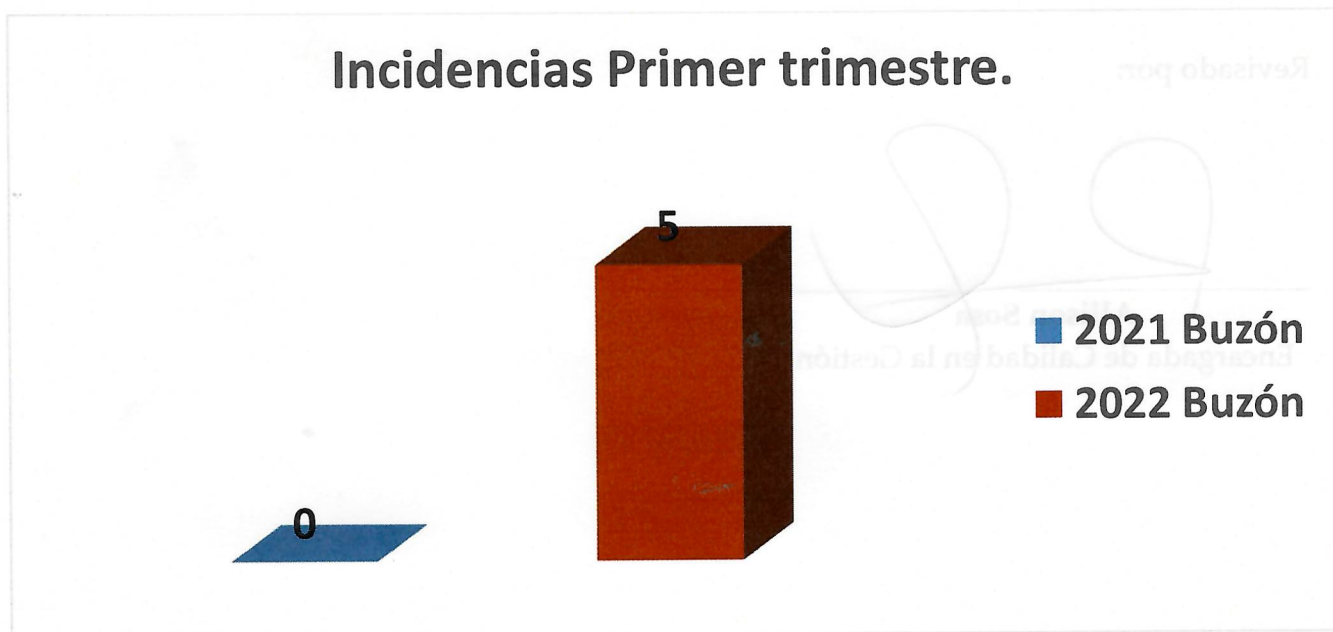
Gráfico 1- Comparación de incidencias de distintas vías de contacto.

El siguiente grafico resume las incidencias del año 2021 y 2022: